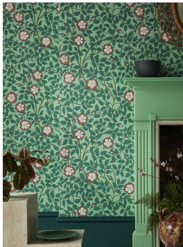
8. Briar Rose – Green Verditer. Mid Azure Green™ 96. Green Verditer™ 92.