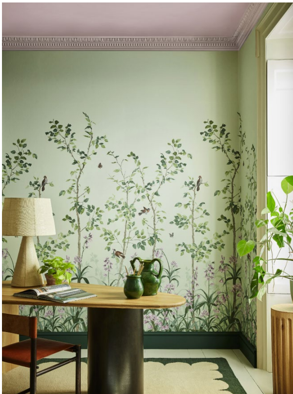
1. Bird & Bluebell – Pea Green. Dorchester Pink® 213. Green Stone - Light™ 269. Puck™ 298.