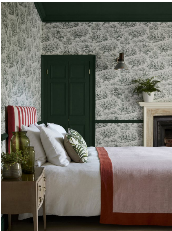
13. Lovers' Toile – Puck. Puck™ 298.