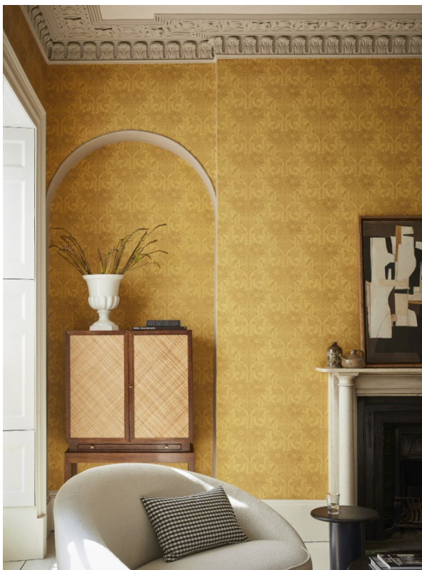
15. Dahlia Scroll – Giallo. Silent White - Pale™ 328. Slaked Lime - Dark™ 151.