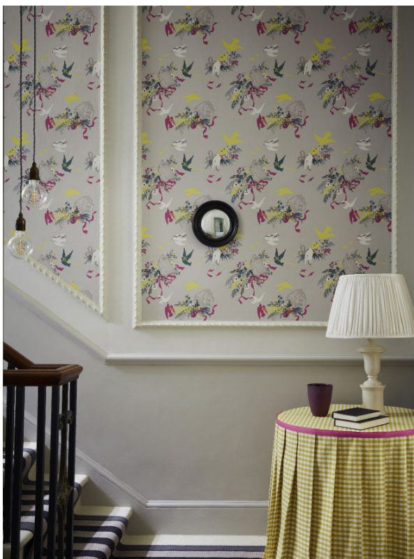
3. Volières – French Grey. French Grey - Pale™ 161. French Grey™ 113.