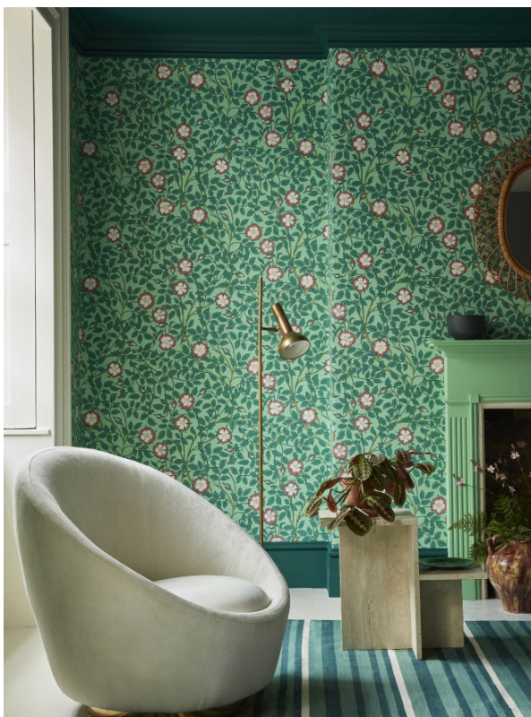
7. Briar Rose – Green Verditer. Whitening™ 41. Mid Azure Green™ 96. Green Verditer™ 92.