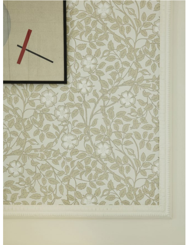
10. Briar Rose – Green Stone. Green Stone - Pale™ 268.