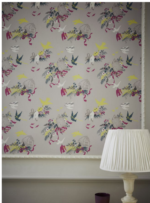
4. Volières – French Grey. French Grey - Pale™ 161. French Grey™ 113.