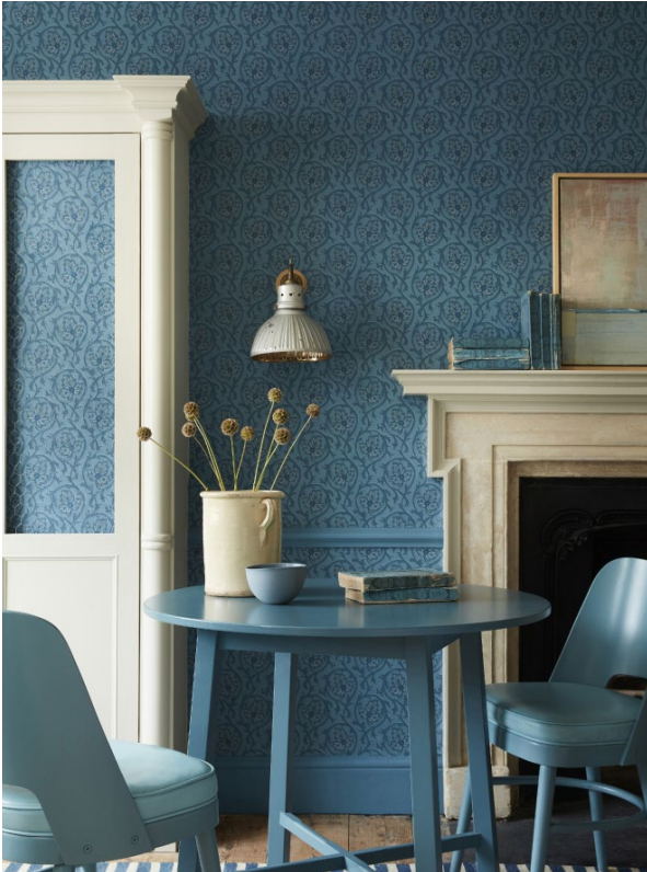
17. Hoja – Air Force Blue. Shirting® 129. Air Force Blue™ 260.