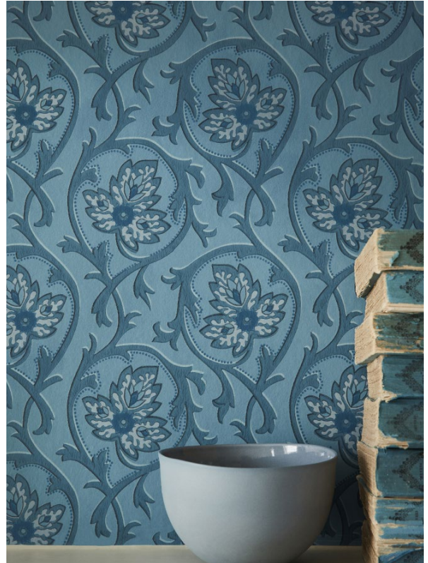
18. Hoja – Air Force Blue.