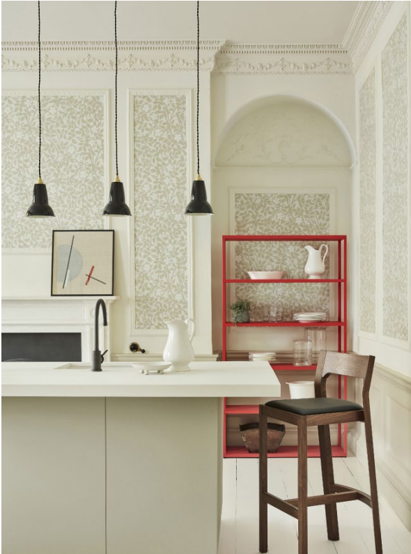
9. Briar Rose – Green Stone. Green Stone - Pale™ 268. Green Stone - Light™ 269. Book Room Green™ 322.