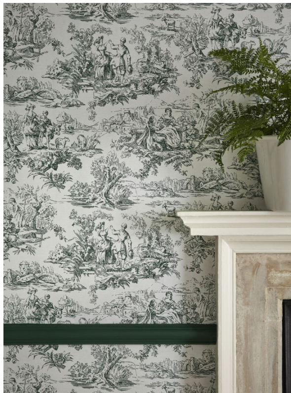
14. Lovers' Toile – Puck. Puck™ 298.