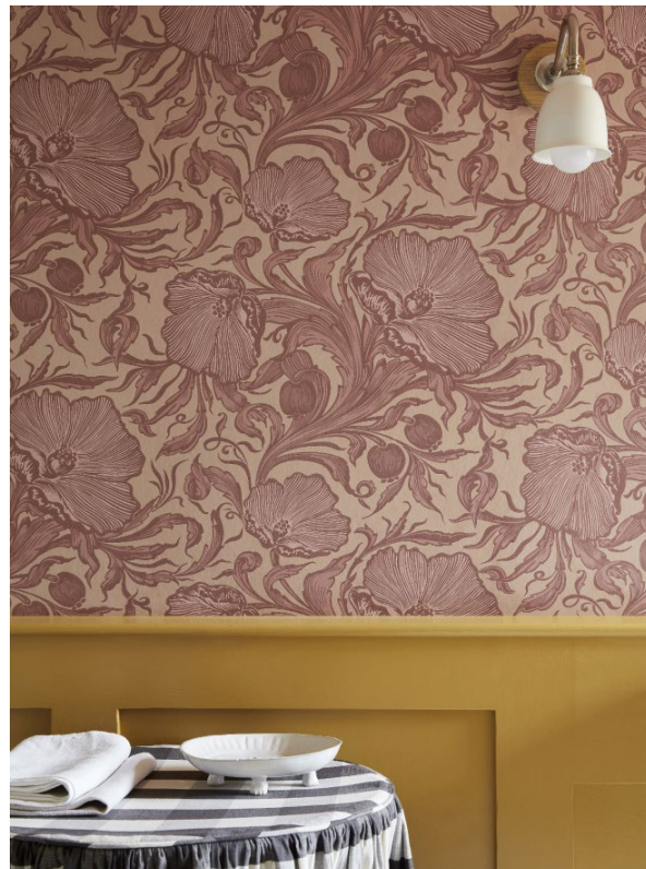
6. Poppy Trail – Masquerade. Yellow-Pink™ 46.