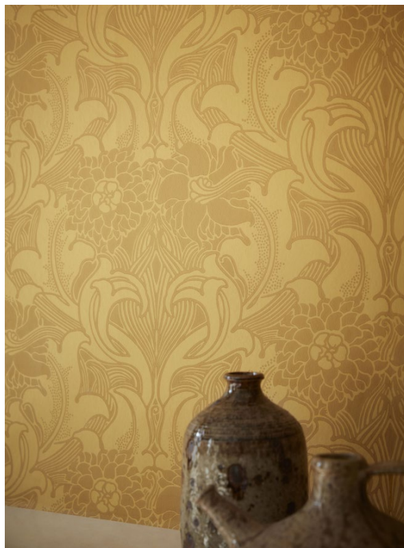
16. Dahlia Scroll – Giallo.