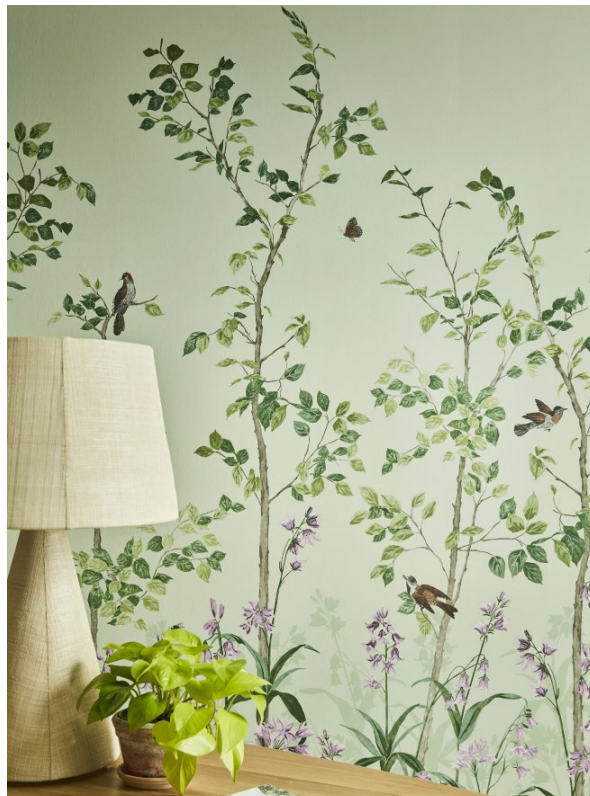
2. Bird & Bluebell – Pea Green.