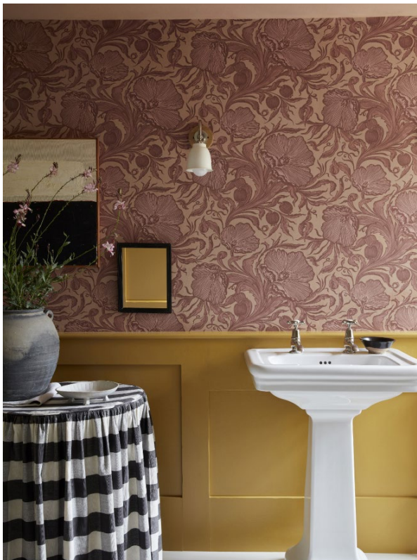
5. Poppy Trail – Masquerade. Masquerade™ 334. Yellow-Pink™ 46.