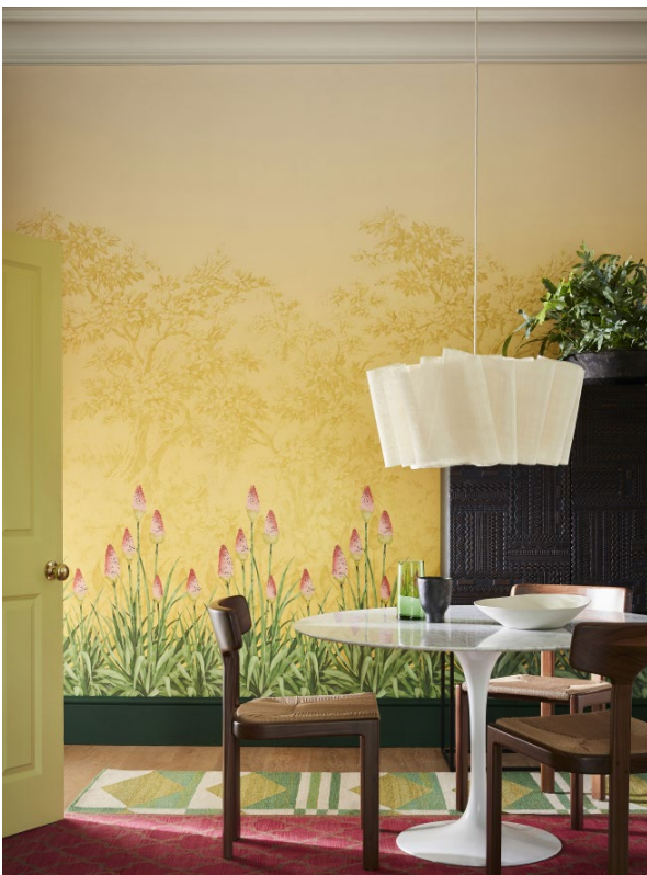
11. Upper Brook Street – Soleil. Puck™ 298. Pale Lime™ 70. Silent White™ 329.